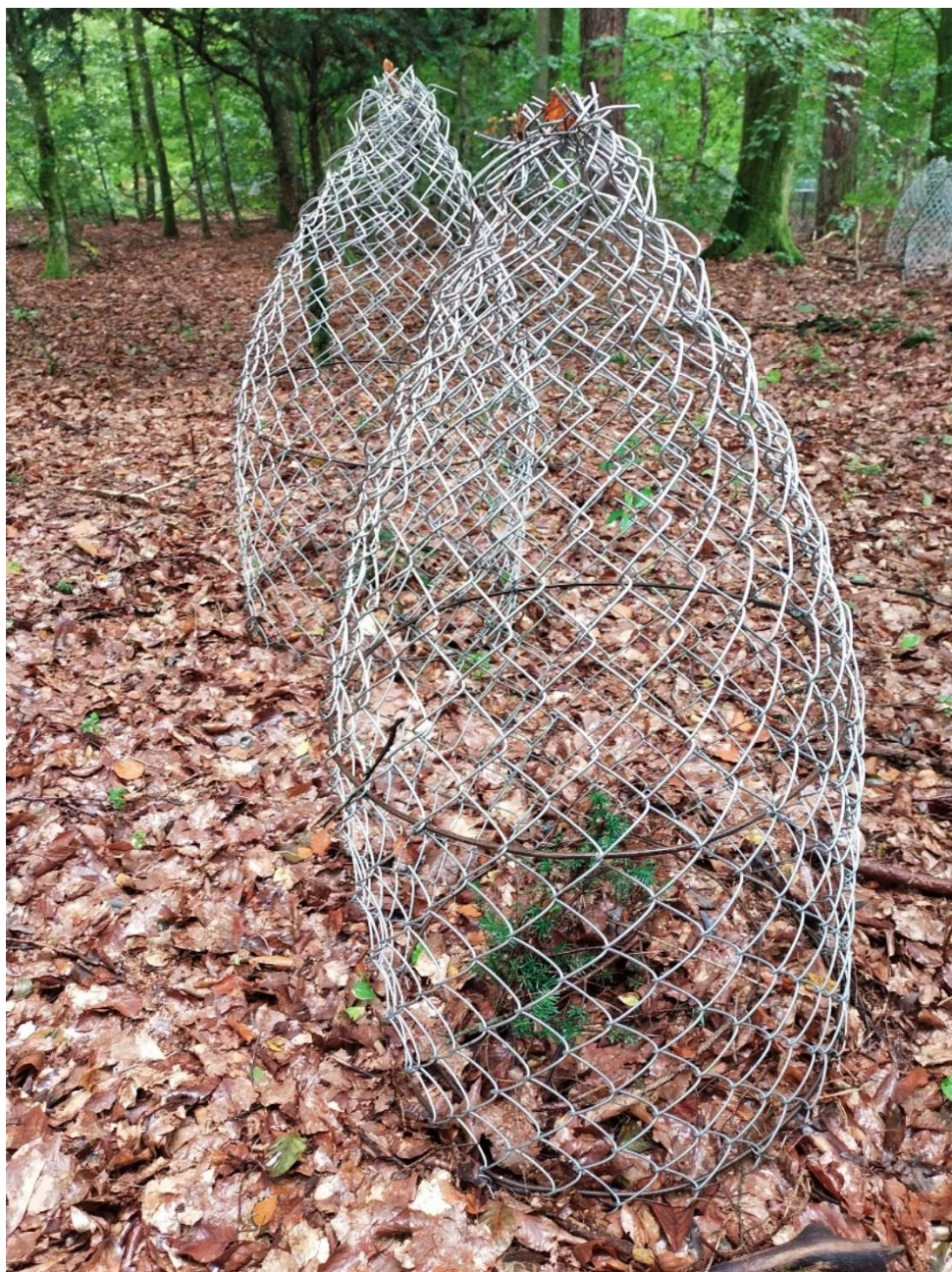
Przykład osłony na cisy.